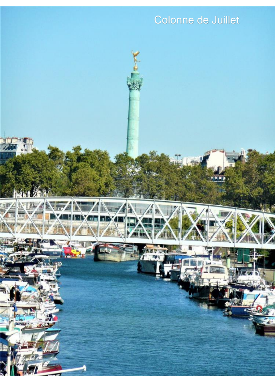
Colonne de Juillet

prison dont l'empreinte est tracée par des pavés dans les rues et sur les trottoirs. La Colonne de Juillet commémore les événements de la Révolution de Juillet 1830. Elle se dresse au centre de la place et célèbre les Trois Glorieuses – trois jours, les 27-28-29 juillet 1830 - la rébellion qui vit la chute du roi Charles X de France et le début de la « Monarchie de Juillet » du roi Louis-Philippe. La colonne fut construite entre 1835 et 1840. Dans sa fondation sont enterrés les restes de 615 victimes de la Révolution de Juillet 1830, ainsi que 200 victimes de la Révolution de 1848. Parmi les autres caractéristiques notables de cette place, citons le moderne Opéra Bastille et le canal du Port de l'Arsenal .