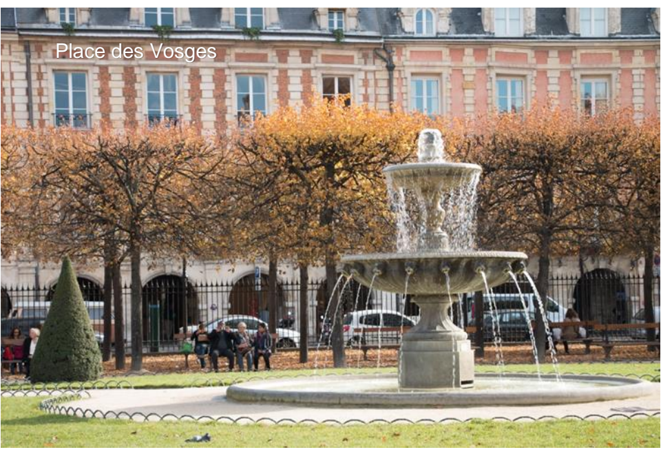
Place des Vosges

Depuis la place de la Bastille, prenez le boulevard Beaumarchais jusqu'à la rue du Pas de la Mule. Tournez à gauche et suivez-la jusqu'à la Place des Vosges . Flânez à travers le square Louis XIII , admirez la statue au centre et passez devant la maison de Victor Hugo , aujourd'hui un musée gratuit exploité par la Ville de Paris.